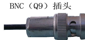
BNC (Q9) 插头